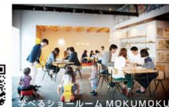
学べるショールーム MOKUMOKU