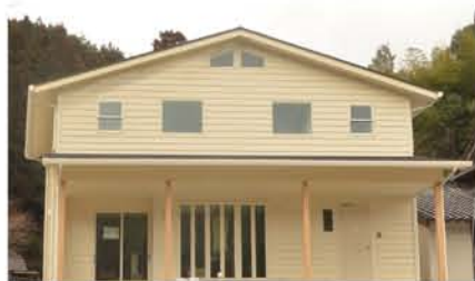
surfer's house 完成次第個別案内可能です

おかげさまで今年度もたくさんのお家づくりに 携わらせていただきました。 まもなく完成予定のお家も多数。 完成次第、ご案内可能物件の予定もございます。 今回の見学会開催場所のような平屋もあれば アメリカンスタイル、スタイリッシュなお家、かわいいお家など 様々なテイストのお家を建築しております。 詳しくはお気軽にお問い合わせください！