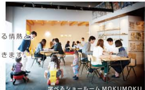
学べるショールーム MOKUMOKU