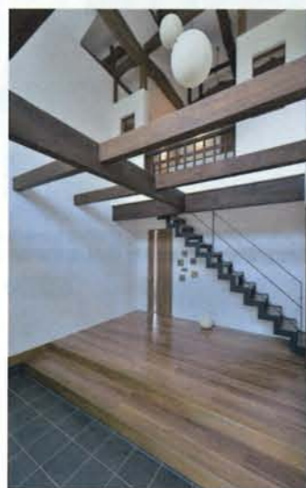
土間の広さと鉄骨のスケルトン階段が特長の玄関。吹き抜けから明るい陽射しが差し込む