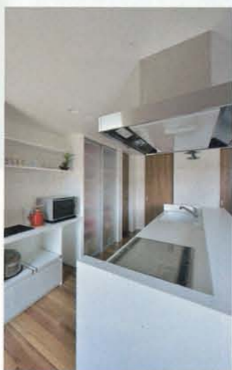
使いやすさを重視したキッチン収納も充実。食器棚の奥は食品ストック用のスペースに