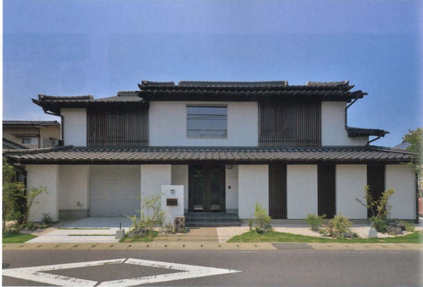
屋根瓦は既存の物を使用し、日本家屋の雰囲気を活かしながらモダンな要素も融合させた外観は、凛とした佇まいが美しい。スタイリッシュにデザインされた庭のグリーンがその美しさをより引き立たせている。駐車場からのエントランスアプローチは格子状にすることで、外からの程よい目隠しになりながらも閉塞感がないように工夫がされている