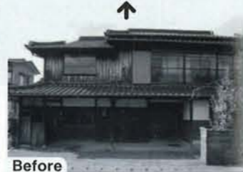
Before 築100年以上の住まいの良さを活かしながら、家族の暮らしに合うようにしたいと考えた