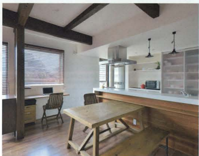
ダイニングテーブル奥のPCスペースは、キッチンから目の届きやすい位置にある。夫人のワークスペースとしてだけでなく、お子さんの宿題などさまざまな用途で使用している