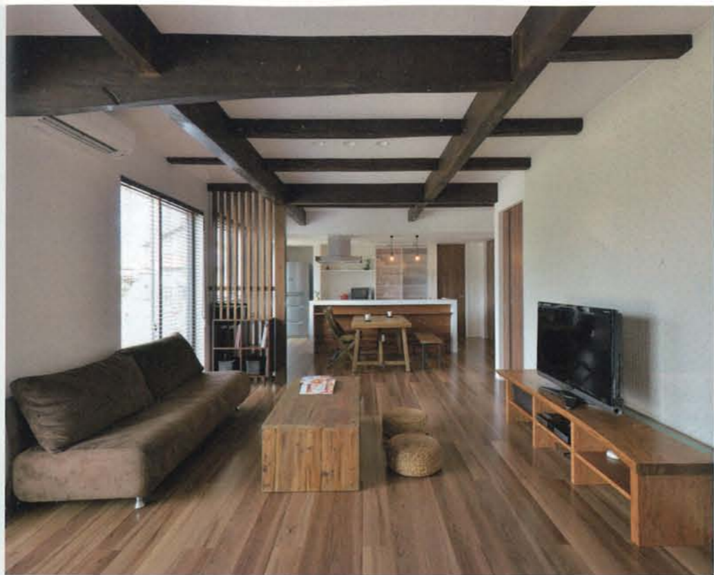
天井の梁をダイナミックに見せた大空間のLDKは、古民家の趣を活かしながらもモダンな雰囲気。リビングテーブルは古材を使用して造作。日の光が入り込む明るい住まいは、断熱・気密性にもこだわり、開放的で快適な空間に生まれ変わった(施工:住まいプロホームウェル 唐津)