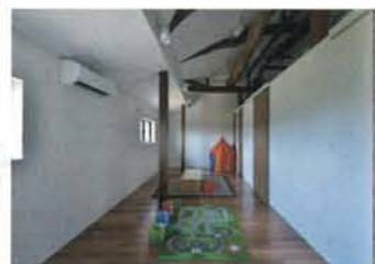
子ども部屋は勾配天井と丸太梁を見せるように設計。日本家屋の特長を存分に活かした