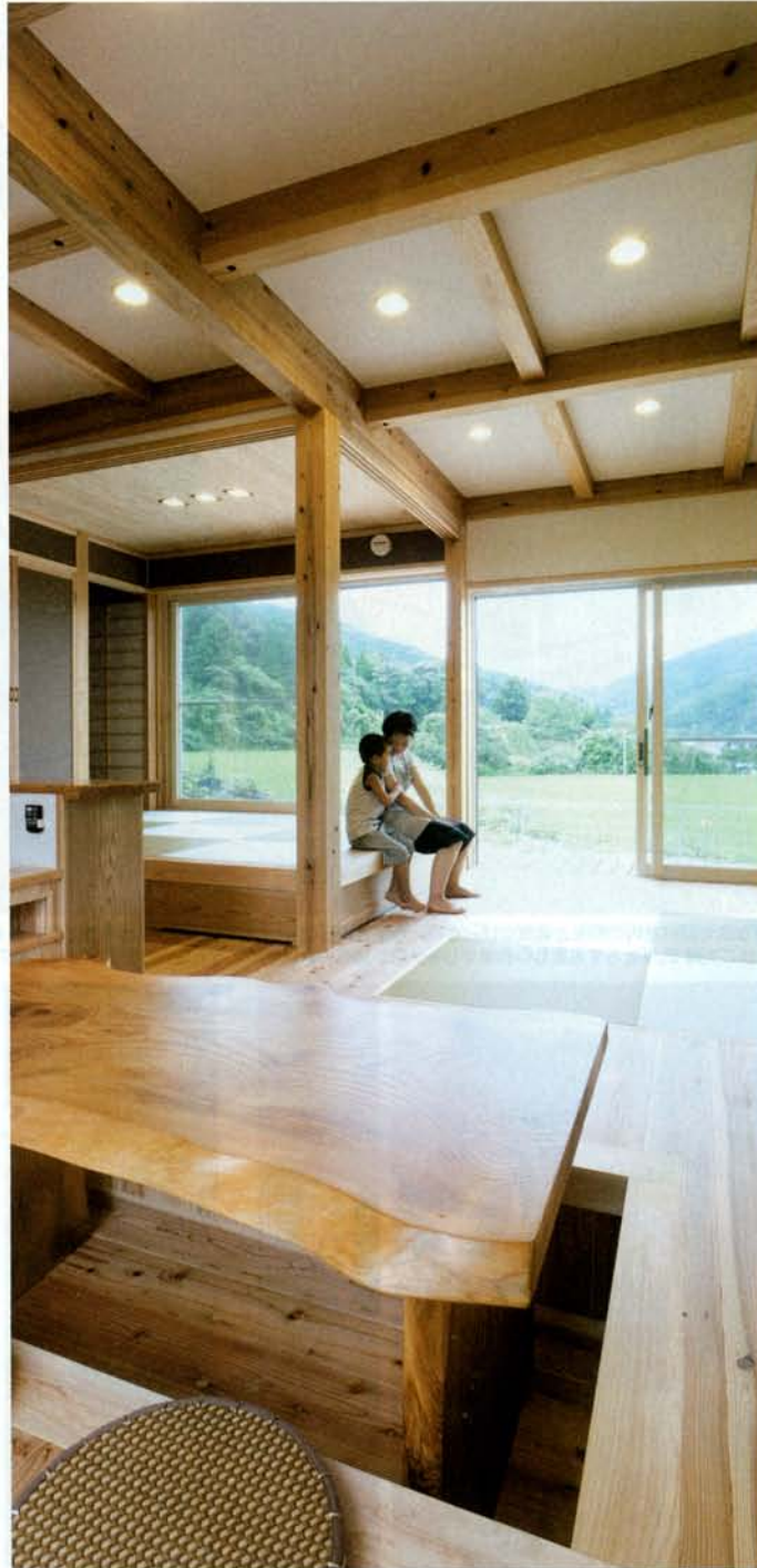
目前に広がる山々と田園風景。広大な緑の借景を毎日楽しむことができる「郷(さと)の家」。建築地ならではの自然の風を活かす設計を心がけた。風抜けがよく清々しい住空間