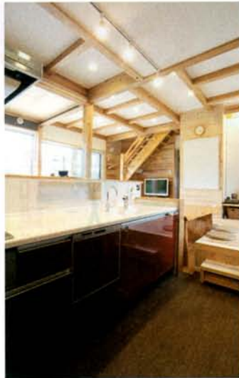
床を下げた土間のような回遊型のキッチン。システムキッチンの色はお子様のチョイス