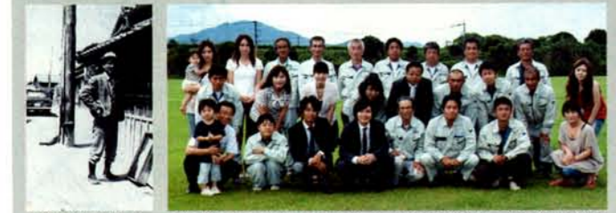
創業当時の写真。和気あいあいという言葉がぴったりな同社の社風。打ち合わせの歴史を感じる1枚 などでも笑いが絶えない。アットホームな雰囲気の中で家づくり