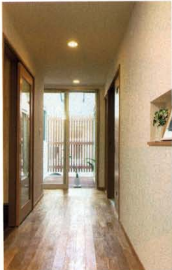
光と風を呼び込むウッドデッキ。屋根をかけることで室内はさらに明るく