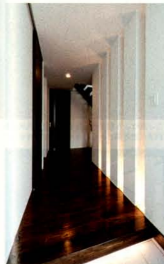
エントランスホールの照明にもこだわり。訪れる人をいざなう光の帯