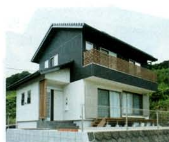
緑の中に凛と佇むY様邸。室内は構造材を見せた現し工法。木組みの美しさを堪能できる