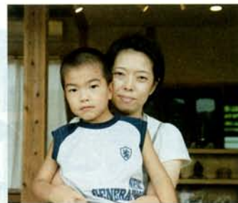
「本当に風が良く通るので、今年の夏は1ヶ月間クーラーいらざでした」