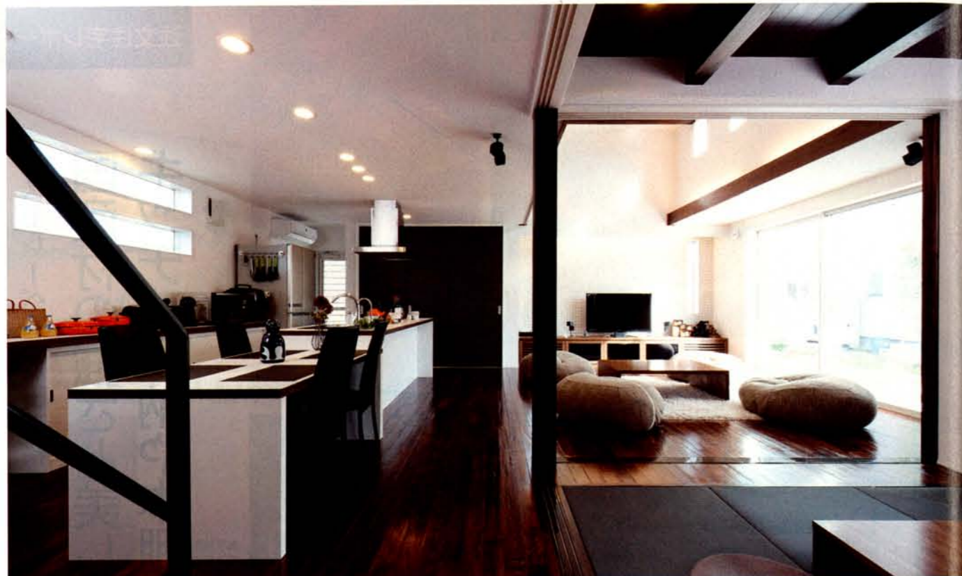
シャープなディテールをプラスしたモダンなLDK。日当たりの良い南側にはワイドな窓。暖かな陽だまりに包まれて、午後のひとときをゆったりと過ごす。広がりを感じる空間はリビングの吹抜けでさらに明るく開放的に感じられ。対して和室は天井はやや低めに。雰囲気ある床はアンティーク塗装を施した無垢材。同社のショールームと同じにしたいというオーナーの希望