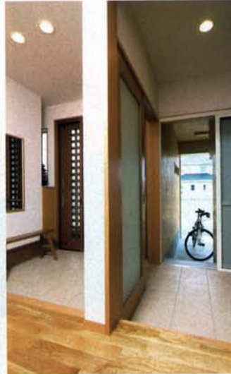
玄関は自転車用インナーガレージ、シューズクロークと連動。使い勝手がよく好評だ