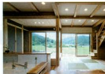
キッチンからの緑が煌めく潤いある眺め。家事をしながらも豊かな気持ちになれる