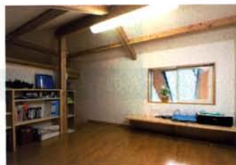
屋根裏部屋の秘密基地みたいなロフト。高さがあるので立ち回りもラクラク