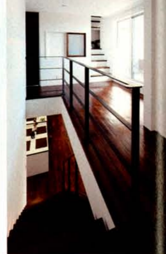
階段をセンターに部屋を振り分けて配した2階。スキップフロアはユーティリティ