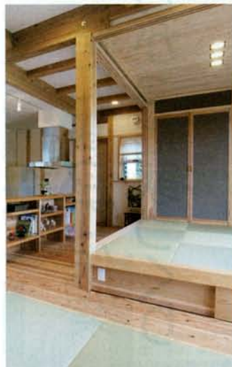
小上がりの和室の下は引き出し収納。家中に爽やかな薫りを漂わせるのは県産の杉材