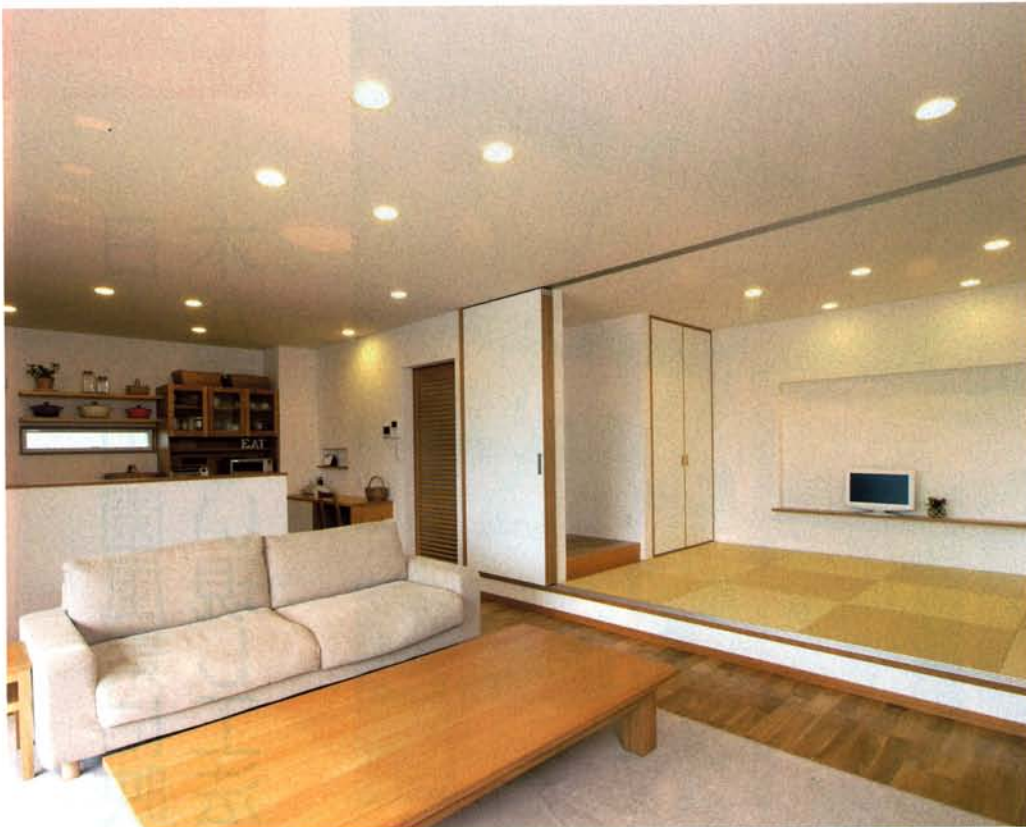
ゆったり大空間のリビングルーム。南向きの大きな窓を設け室内の採光と通風はばっちり。和室との仕切りはフルオープンになるので格別な開放感。家づくりの最後の仕上げ、床の塗料塗りはご夫婦で。「とっても楽しい作業でした。思い通りの色になってうれしいです」