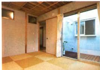
デッキと隣接、畳敷きの落ち着いた寝室。隣室へ光を運ぶ窓があり、採光へこだわっている