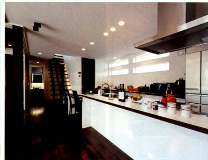
メラミンワークトップのこだわりキッチン。ダイニングテーブル、カウンターとトータルコーディネートされたオーナーのお気に入りだ。キッチンの水栓はドイツのグローエ社製