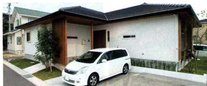
「絶対に平屋の家がいい」と要望されていたオーナー。敷地を活かし、風と光が計算された住まい。軒を長くして、夏と冬の太陽光の入り方が変わるように工夫