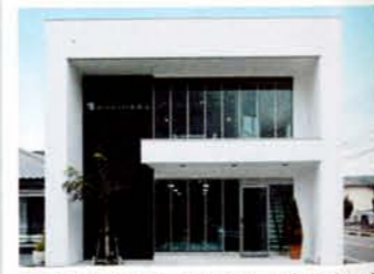
孝和建设本社ビル。唐津道路「唐津IC」から近く、わかりやすいロケーション