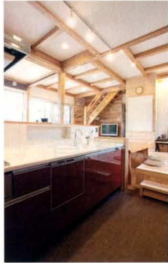
床を下げた土間のような回遊型のキッチン。 システムキッチンの色はお子様のチョイス

A 風の通り道のダイニング テーブルが家族のお気 に入ります。低い視線で 景色を眺められますし、 夫婦でお酒を楽しん だりすることも。今後は 庭に手を入れて、家庭 菜園を始めようと思っ ています。