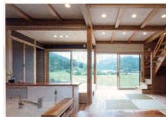
キッチンからの緑が煌めく潤いある眺め。家 事をしながらも豊かな気持ちになれる