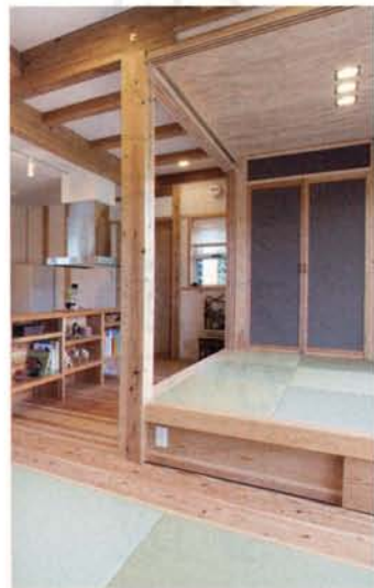
小上がりの和室の下は引き出し収納。家中に 爽やかな薫りを漂わせるのは県産の杉材