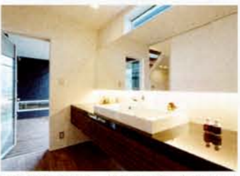
ホテルのサンタリーをイメージしたスタイリッシュ空間。オリジナル造作の洗面化粧台