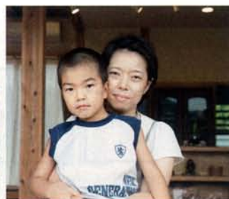
「本当に風が良く通るので、今年の夏は1ヶ 月間クーラーいらざでした」