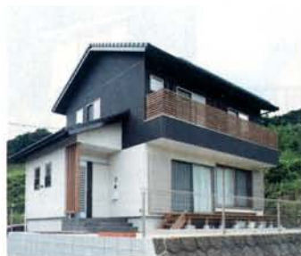
緑の中に凛と佇むY様邸。室内は構造材を見 せた現し工法。木組みの美しさを堪能できる