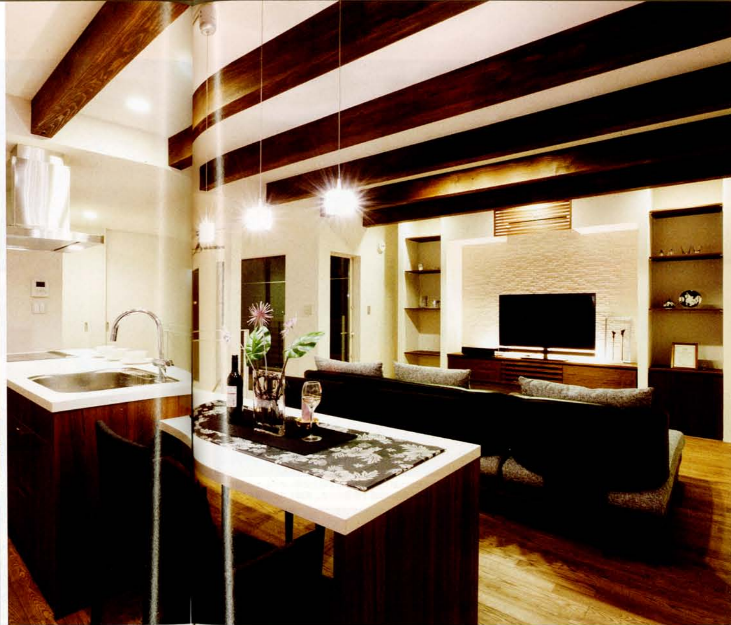
温かさと高級感が漂うリビング・ダイニング。「洗練されたシンプルさ」を引き出すデザインディテールが織り込まれた空間だ。同社が得意とするのがライティング提案。オリジナル造作のTVボードは間接照明を埋め込み、シアタールームのような雰囲気だ（写真はすべてS邸）