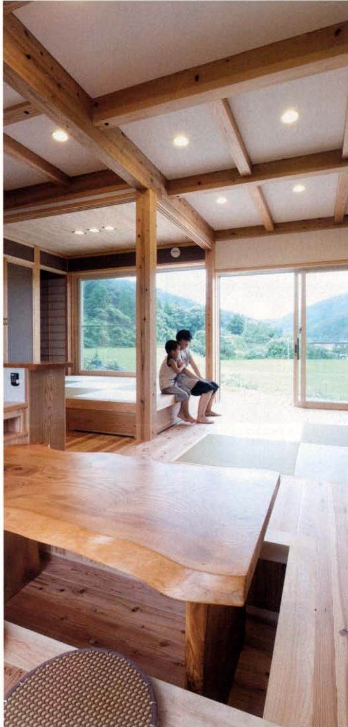
目前に広がる山々と田園風景。広大な緑の借景を毎日楽しむことができる「郷(さと)の家」。建 築地ならではの自然の風を活かす設計を心がけた。風抜けがよく清々しい住空間