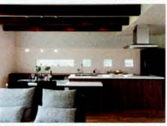
壁に面したカウンターやダイニングの椅子に腰かけたときの視線に合わせ、窓を配置