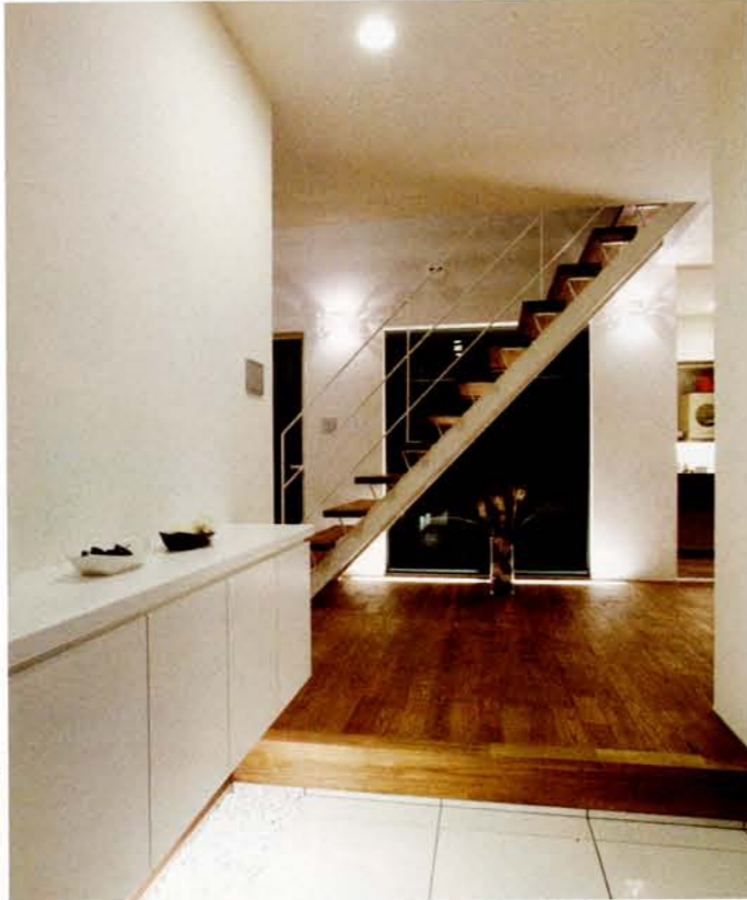
玄関と連続する開放的なホール。空間を横切って2階へ続く階段は蹴込み板がないスケルトン。窓が切り取る裏庭は、季節ごとに変化する絵画のよう