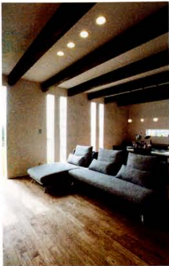
開口には景観を遮る邪魔なフレームをなくした次世代ウィンドウ「サーモス」を使用