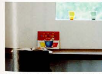
インテリアコーディネートも同社による提案。施主の要望を聞いてオシャレにセッティング