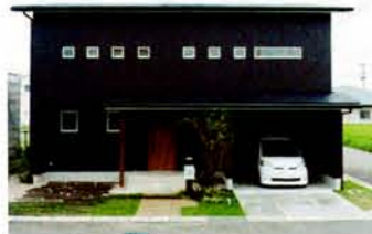
ビルトインガレージ。住空間のトータルデザインのためガーデン設計にも力を入れている