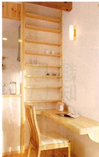
親の目が届くところで使えるように、ダイニングの一角にあるパソコンコーナー