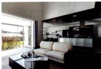
リビングの大きな窓はフルオープンにして、四季折々季節を身近に感じる暮らし