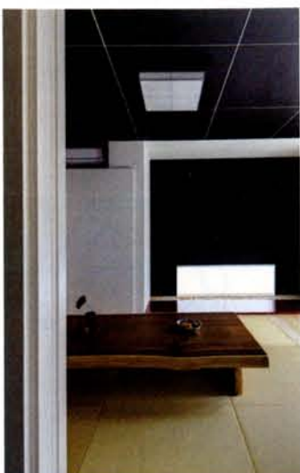
床板と座卓の上質な素材が室内のモダンな仕つらえに和の趣を添えている