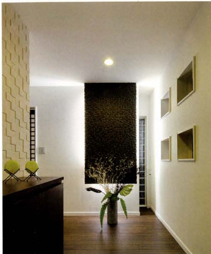
玄関ホールからリビングへの壁はさまざまに意匠が凝らされギャラリーのよう。小さく施された窓は視線を避け外観にアクセントを、室内には差し込む光に豊かな表情をもたらす