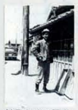
創業当時の写真。いつも笑顔が絶えず、和気あいあいという言葉がぴったりな同社の歴史を感じる一枚

木材店から始まり良質の佐賀県産材を供給してきた同社。その後高度成長期にともない自社でも建築の請負業を始めたという歴史を持つ。その着実な歩みは2009年～2010年の注文住宅着工実績が唐津市1位、佐賀県内では地元ビルダーとしては4位という結果に現れている。（フクニ住宅新聞調べ）