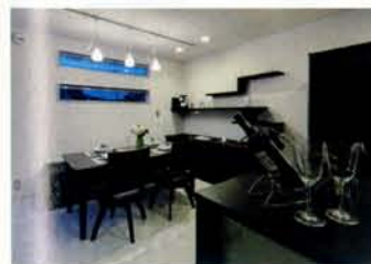
リビングとは対照的に窓の小さなダイニング。雰囲気の良いバーのような大人の空間