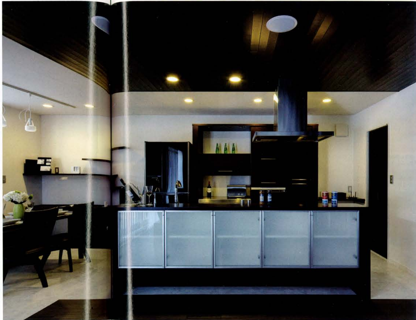
「ハウス・イズ・ビューティフル」とタイトルづけたモダンハウス。ミッドセンチュリーのテイストを感じる邸内には、木の風合いが効果的に配されて、木材に造詣が深い同社らしさを感じられる（左右ページの写真はすべて同社施工例。撮影/大野博之）