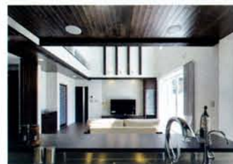
キッチンに立つとリビングからダイニング、庭まで見渡すことができる