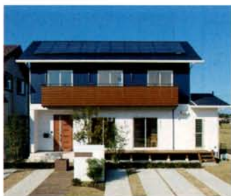
ツートーンカラー、ガルバリウム使用でシャープな印象に仕上げた外観