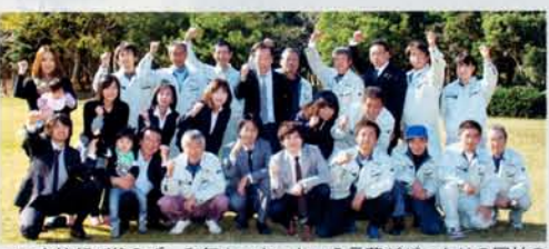
いつも笑顔が絶えず、和気あいあいという言葉がぴったりな同社の社風。アットホームな雰囲気の中