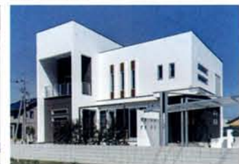
キューブスタイルの外観。青空と白い壁のコントラストが美しい