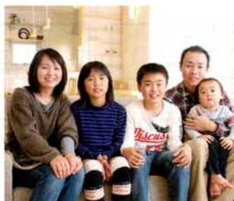
要望以上の出来上りに大満足。お子様たちには個室もできて新しい暮らしに夢が膨らむ