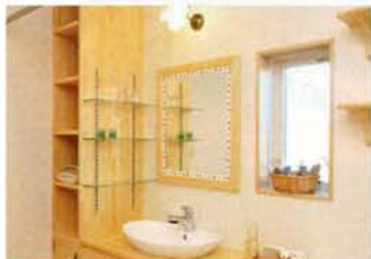
家族で使う洗面鏡は、個室のテーマカラーと同色のビー玉をみんなで飾った手作り