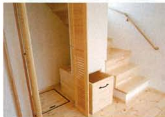
階段の下を利用した収納。木箱のおもちゃ入れは引き出して使えるように工夫