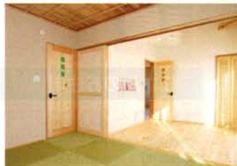
個室のドアは各人のテーマカラー入り。末のお子様の部屋は両親の部屋とつながっている