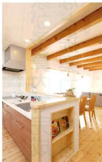
散らかりがちな新聞や雑誌は場所を決めて収納。カウンターに作ったマガジンラック