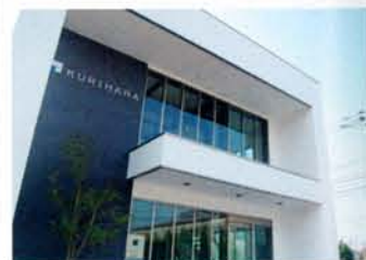
孝和建设ビル。2階のショールームではお茶をいただきながらゆっくりと相談できる